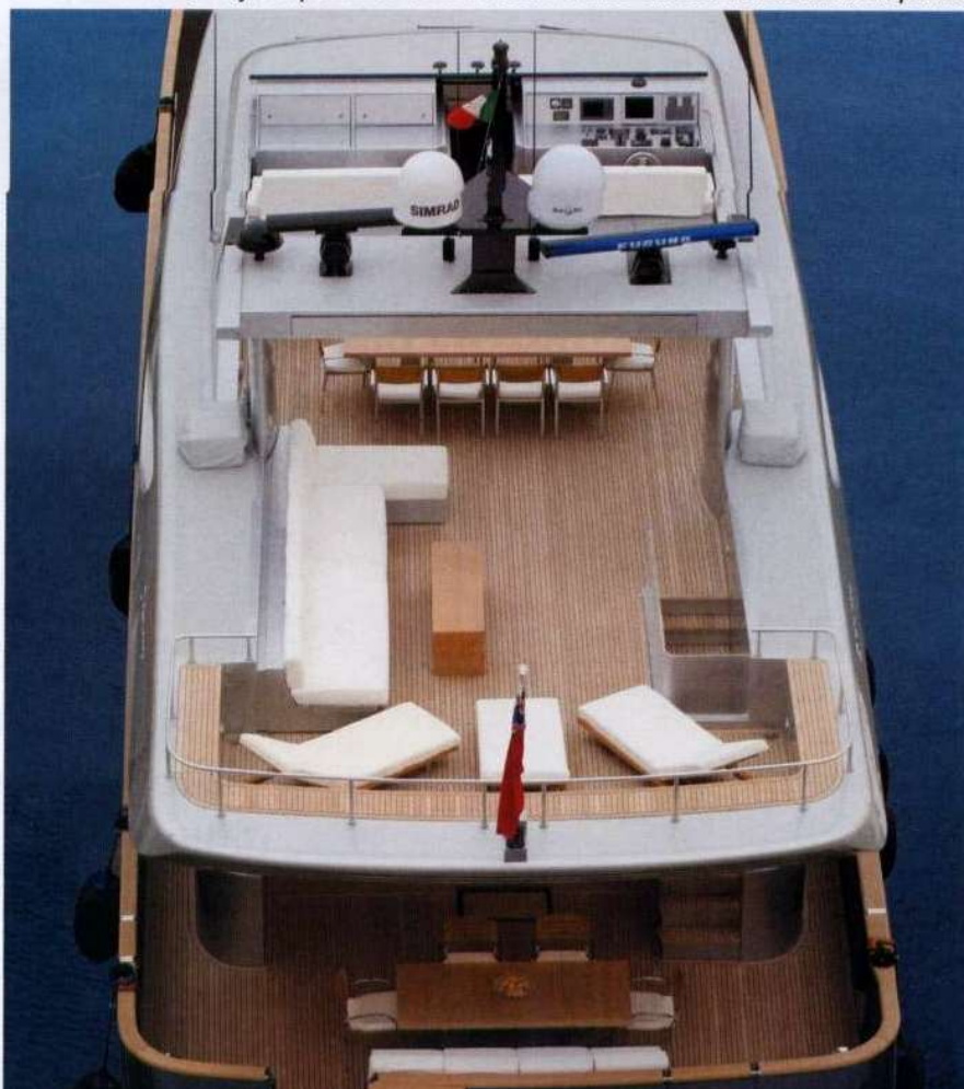
Sopra, il grande salone centrale con una disposizione simmetrica degli arredi interni. Uno spazio accogliente e luminoso, con pochi pezzi di design italiano. Sotto, il fly e il pozzetto sono in teak. Pulito ed essenziale anche il ponte.