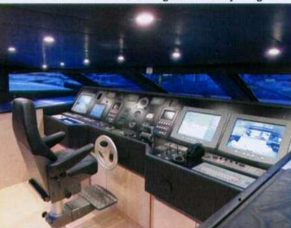
Sotto, la zona della timoneria collocata a un livello intermedio tra la zona giorno e il flybridge.